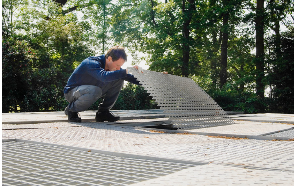
ATB-Mitarbeiter überprüfen und warten regelmäßig das System, um einen reibungslosen Ablauf des gesamten Geschäftsbetriebes gewährleisten zu können.

SIONAL für bis zu 1.000 EW mit den erforderlichen Modifikationen sowie die Anlagensteuerung gebaut, montiert und schließlich nach England verschifft. ATB-Techniker machten sich nun auf den Weg nach England und installierten innerhalb von nur einer Woche die gesamte Anlagen- und Steuerungstechnik und nahmen die Kläranlage in Betrieb. Und nach dem überaus erfolgreichen Testlauf war zu guter Letzt ein freudiges Aufatmen des Mannes zu registrieren, der das Geheimnis seines Erfolges in dem Buch „Take Aktion“ niedergeschrieben hat und den berühmten Vom-Tellerwäscher-zum-Millionär-Mythos tagtäglich vor unseren Augen lebt: Self-made-Millionär Steve Joynes.