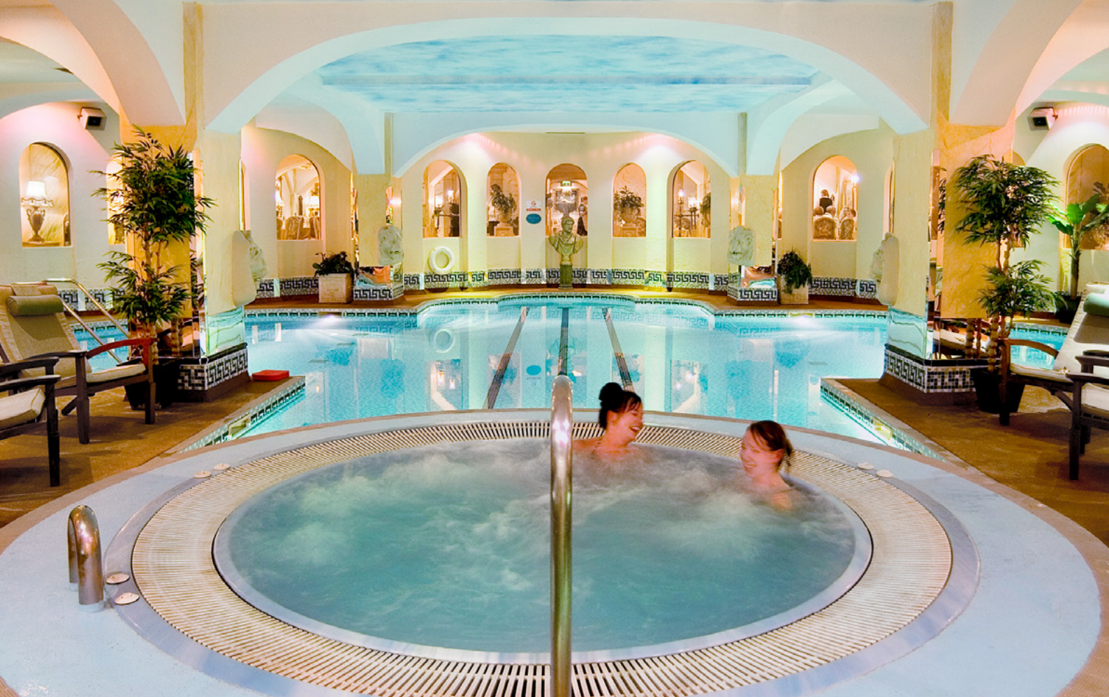
Neben den rund 100 Luxus-Suiten, über 100 verschiedenen Therapie- und Relaxangeboten sowie mehreren unterschiedlichen Restaurants sorgen auch diverse Schwimmbäder für ein hohes Abwasseraufkommen in Hoar Cross Hall.